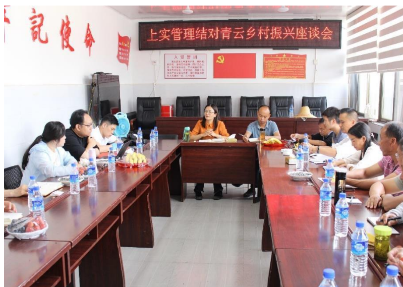
图6 召开上实管理结对青云乡村振兴座谈会

30 万元产业帮扶资金的使用；六是按照相关政策，做好消费扶贫工作。会上，工作组就白书记提到的希望通过党建引领的经费对未来计划中的青云村委党员活动中心扩建、小里黑党支部党建阵地建设、水晶豌豆种植等项目予以支持的想法进行了深入的交流，工作组向白书记详细解释了党建引领及相关经费的具体用途，明确该项经费原则上只以“表彰和鼓励先进党员和群众”为主要目的，突出以点带面的示范作用。工作组也对青云村委开展“我为群众办实事”的工作表示支持和理解，将在汇报党委后，在合理范围内给予帮扶和支持。