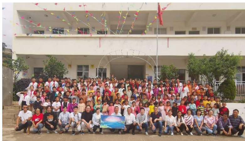
图 5 与青云完小师生合影

在课间休息期间，学校举行了一个简单、温暖的捐赠仪式，工作组代表上实管理海外联合党委向青云完小捐赠了 630 本语数外练习册和 35 个足球、篮球，鼓励孩子们好好学习，健康成长；同时代